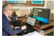
TÜBİTAK 'Araştırma Projeleri'