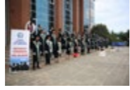
XRNA Resim Sergisi